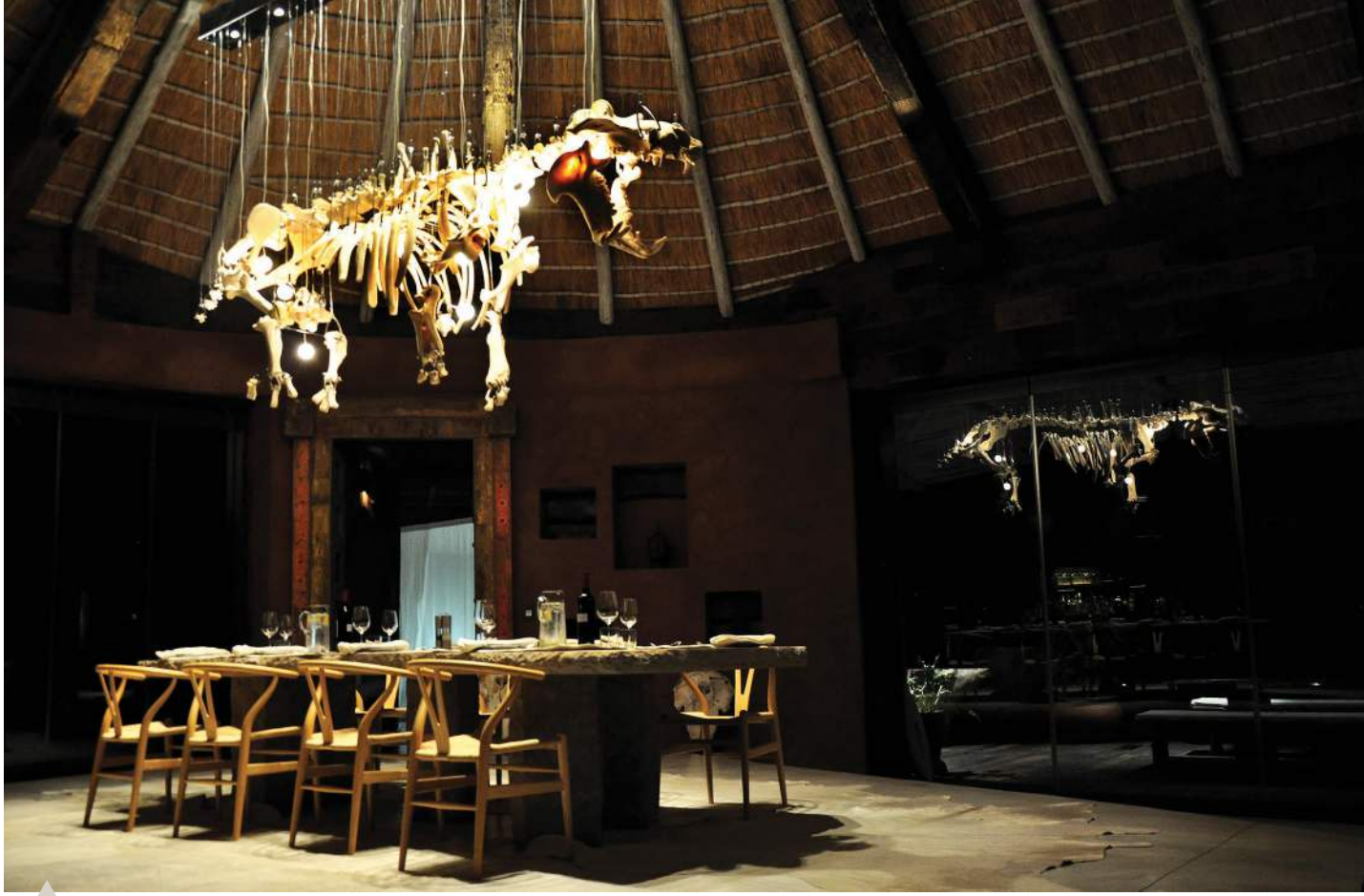
In The Observatory kan gaste by 'n sandsteenblad onder 'n massiewe seekoei-kandelaar aansit.