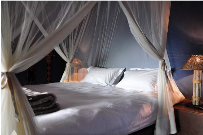
Die slaapkamers in Leobo Lodge is weelderig ingerig.